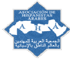
Asociación de Hispanistas Árabes