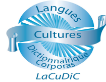
Langues, Cultures, Dictionnaire & Corporas