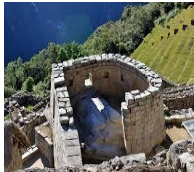
Templo del sol